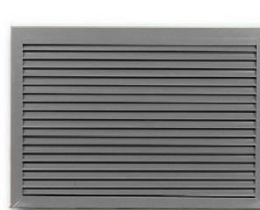
V - Lamelle