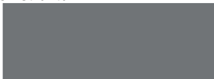
RAL 9007 Graualuminium