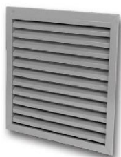
Z - Lamelle